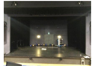
Vue depuis le gradin

Salle Chopin Auditorium de 139 places Idéal pour les conférences et réunions