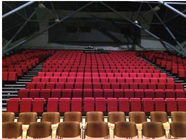
Vue depuis la scène

Loge pouvant accueillir jusqu'à 20 personnes.