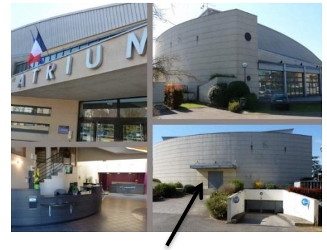
Quai de déchargement à gauche du parking public souterrain

Pour des expositions, conférences, réunions, congrès... vous pouvez louer les salles de l'Espace Culturel L'Atrium. Vous pouvez également organiser un moment convivial autour d'un cocktail pour vos soirées après un spectacle ou une conférence.